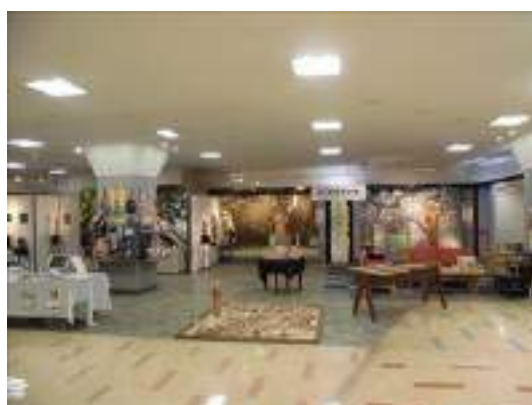
開催初日の会場の様子